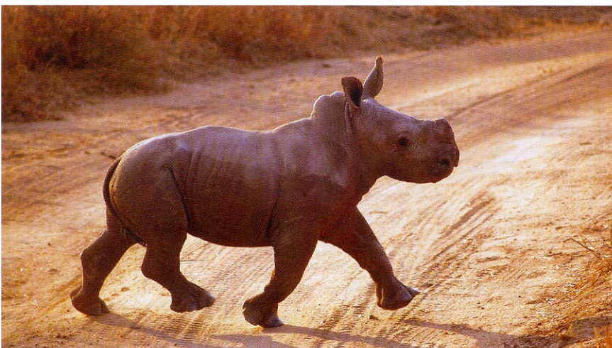
In diesem Naturparadies trifft der Naturliebhaber mitten in der grünen Kalahari auf seltene und gefährdete Tierarten, wie das scheue Wüstenashorn.

Himmel sieht und natürlich wie man bei Marshmallows am Feuer Geschichten erzählt. Ganz sicher ein großes Abenteuer für jedes Alter. Die Schönheit der Natur, in der Tswalu liegt, sowie ein großer Artenreichtum an Wildtieren machen den Besuch in Tswalu unvergesslich. Die Reservatbesucher gehen mit erfahrenen Rangern auf Wildbeobachtungsfahrten im offenen Safarifahrzeug und werden erstaunt sein, wie die Tiere es geschafft haben, sich dieser Gegend anzupassen. Außerdem können Sie auf dem Rücken der Pferde auf Safari gehen, Bogenschießen oder die magische Stille der Kalahari vom Heißluftballon aus genießen. Die Freizeitgestaltung wird individuell auf die Wünsche der Gäste abgestimmt, ob in Gruppe oder ganz privat mit einem eigenen Guide, in Tswalu steht Flexibilität im Vordergrund. Am Ende des Tages kann man den Sonnenuntergang genießen und anschließend den Tag mit einem hervorragenden Abendessen unter freiem Himmel ausklingen lassen. Wem der Tag noch nicht Wildnis genug war, kann in einem „Sleep Out“ sogar unter dem Sternenzelt Afrikas übernachten und ganz nah den Stimmen des afrikanischen Busches lauschen. Im Tswalu Kalahari Private Game Reserve erlebt man Afrika von seiner besten Seite: Hier ist man der Natur und der Wildnis zum Greifen nah und kommt gleichzeitig in den Genuss einer luxuriösen Unterkunft, Feinschmeckerspeisen und erstklassigen Wellness-Anwendungen.