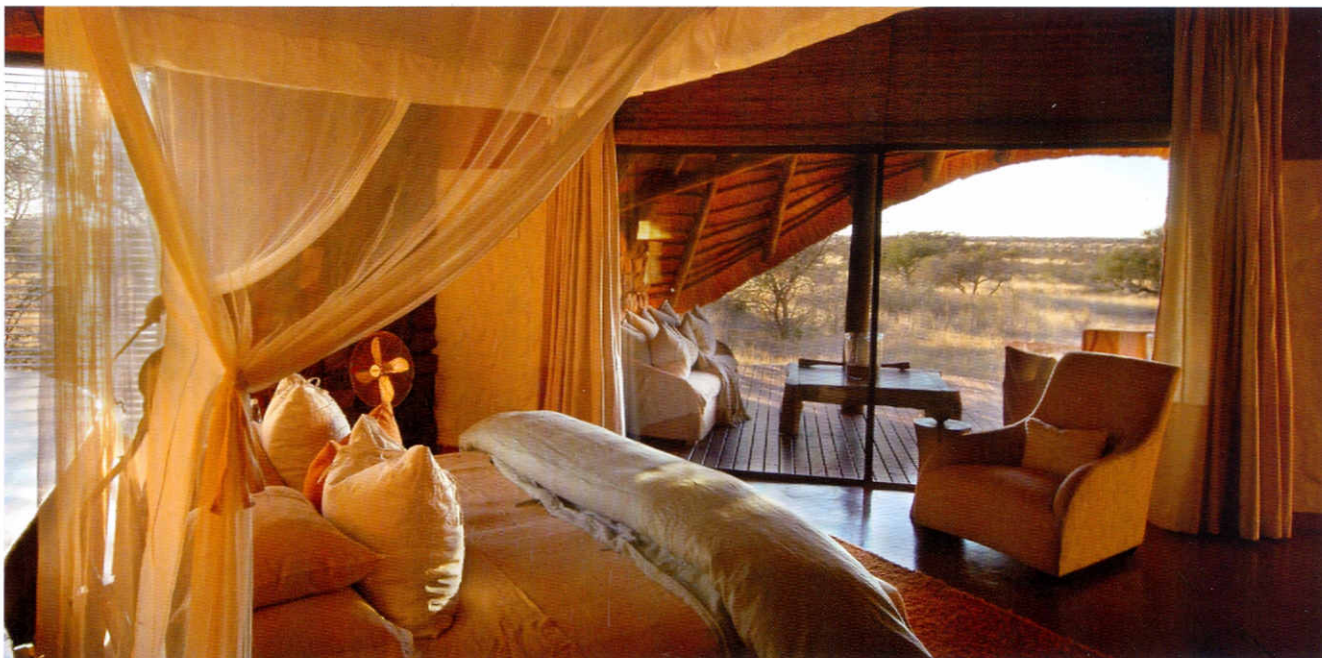
Die Suiten des Tswalu Kalahari Naturreservats im freistehenden Bungalow sind individuell und mit viel Liebe zum afrikanischen Stil eingerichtet. Das gemütliche Interieur wird durch warme Farben, Naturhölzer und zeitgenössische Kunst vereint mit der Natur, bestimmt.