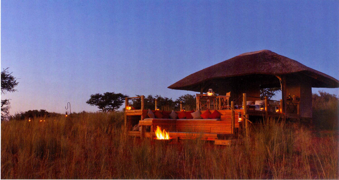
Ein weiteres, ganz besonderes Erlebnis in Tswalu erhält der Gast bei der „Malori Sleep out experience“. Hier können Abenteuerlustige unter dem freien Sternenhimmel Südafrikas übernachten.

riöse Suiten, die im afrikanischen Stil eingerichtet und aus Naturstein gebaut sind. Zum anderen kann der Gast in der privaten Villa „Tarkuni“ logieren, die in einem Tal in völliger Abgeschiedenheit liegt und exklusiv für bis zu 10 Personen gebucht werden kann – der ideale Ort für Familien oder besondere Anlässe. Ein eigener Koch und Service sowie ein eigenes Wildbeobachtungsfahrzeug stehen den Gästen hier ebenfalls zur Verfügung.